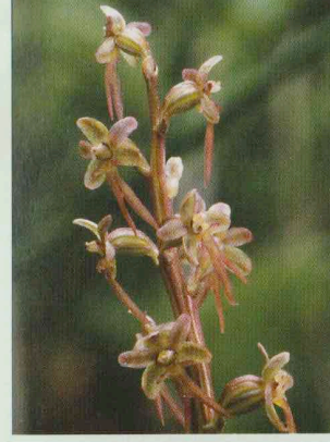
Kleines Zweiblatt Listera cordata