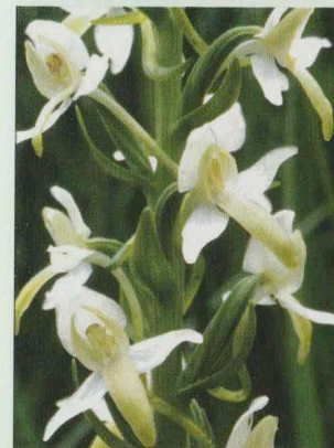
Zweiblättrige Waldhyazinthe Platanthera bifolia