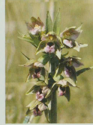
Niederländische Stendelwurz Epipactis helleborine ssp. neerlandica