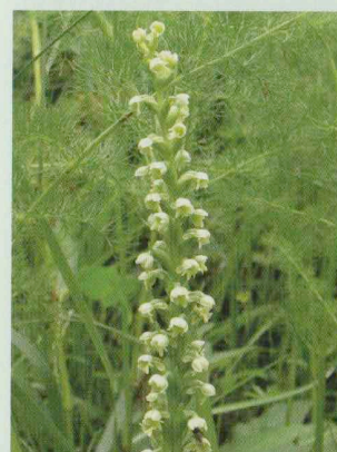
Weiße Höswurz Pseudorchis albida