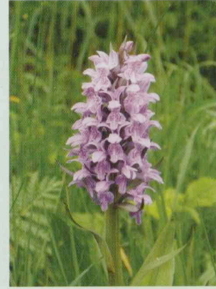
Übersehene Fingerwurz Dactylorhiza praetermissa