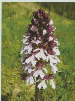
Purpur-Knabenkraut Orchis purpurea