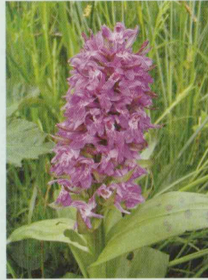
Breitblättrige Fingerwurz Dactylorhiza majalis