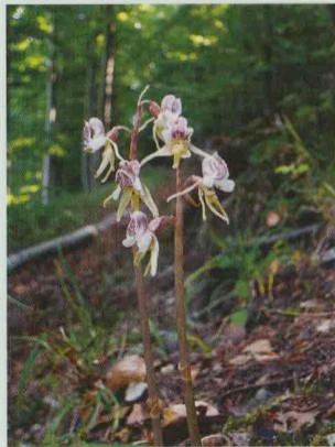
Blattloser Widerbart Epipogium aphyllum