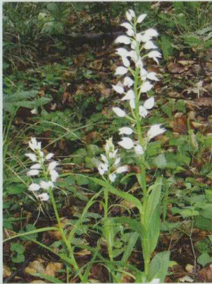
Schwertblättriges Waldvögelein Cephalanthera longifolia