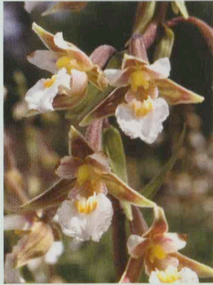
Sumpf-Stendelwurz Epipactis palustris