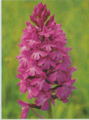
Pyramidenorchis Anacamptis pyramidalis