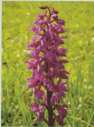
Männliches Knabenkraut Orchis mascula