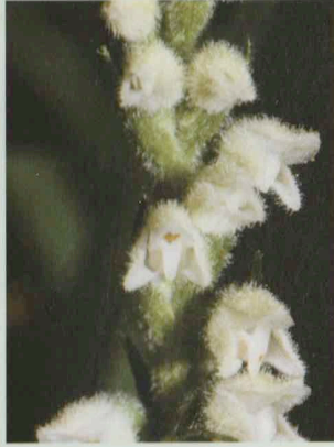
Kriechendes Netzblatt Goodyera repens