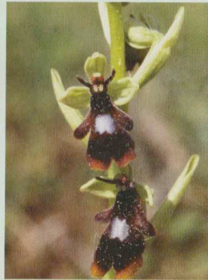
Fliegen-Ragwurz Ophrys insectifera

Schmegel - Marketing - Gestaltung - Werbung - info@schmegel.com