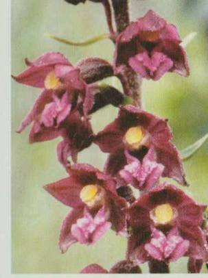
Braunrote Stendelwurz Epipactis atrorubens