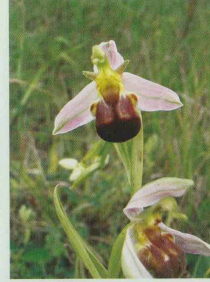
Zweifarbige Bienen-Ragwurz Ophrys apifera var. bicolor