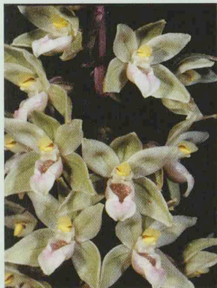
Violette Stendelwurz Epipactis purpurata