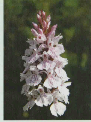
Fuchs' Fingerwurz kälteliebend Dactylorhiza fuchsii ssp. psychrophila