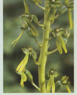
Großes Zweiblatt Listera ovata