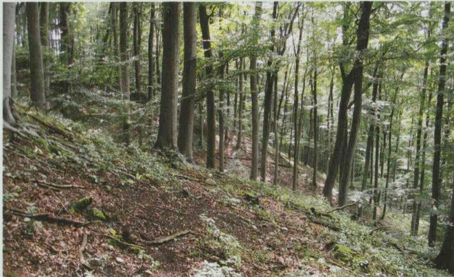
Wärmeliebender Wald auf Kalk