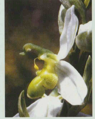
Gelbe Bienen-Ragwurz Ophrys apifera var. chlorantha