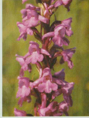
Mücken-Händelwurz Gymnadenia conopsea