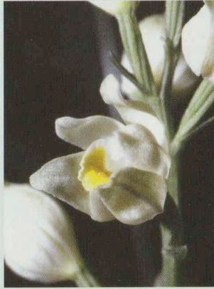
Weißes Waldvögelein Cephalanthera damasonium