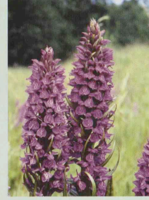
Gefleckte übersehene Fingerwurz Dactylorhiza praetermissa var. junialis