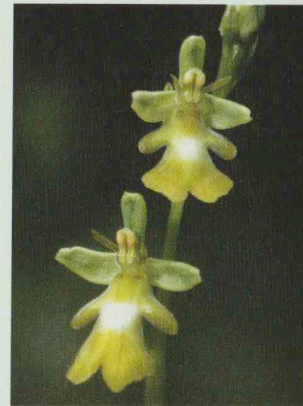
Fliegen-Ragw., Blassgelbe Varietät Ophrys insectifera var. ochroleuca