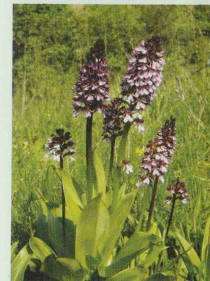
Purpur-Knabenkraut Orchis purpurea