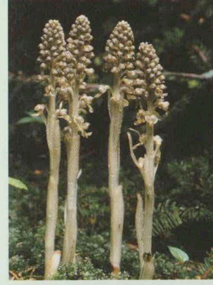
Vogel-Nestwurz Neottia nidus-avis