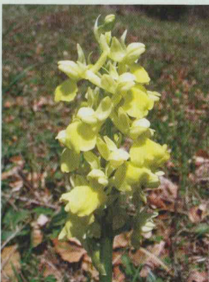
Bleiches Knabenkraut Orchis pallens