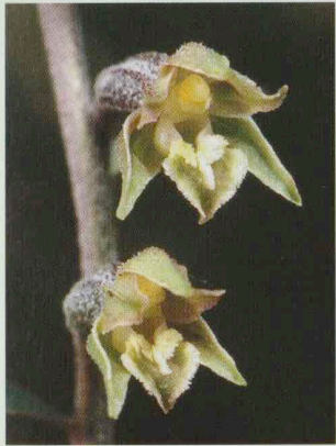
Kleinblättrige Stendelwurz Epipactis microphylla