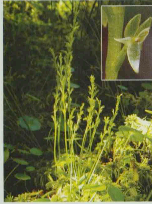
Sumpf-Weichorchis Hammarbya paludosa