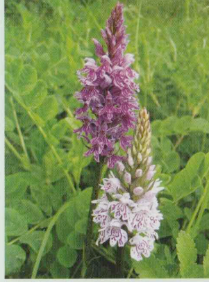
Fuchs' Fingerwurz Dactylorhiza fuchsii