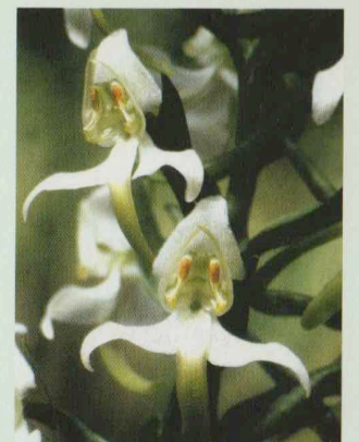
Grünliche Waldhyazinthe Platanthera chlorantha