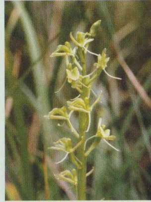
Torf-Glanzkraut Liparis loeselii