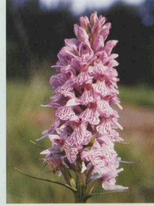
Gefleckte Fingerwurz Dactylorhiza maculata