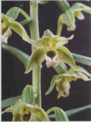
Übersehene schmallippige St.wurz Epipactis leptochila ssp. neglecta