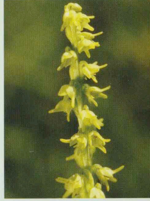
Kleine Einknolle Herminium monorchis