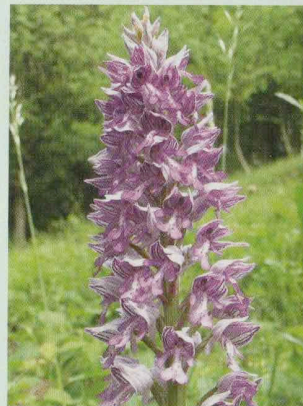
Helm-Knabenkraut Orchis militaris