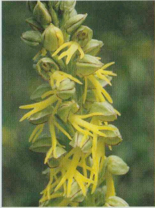
Ohnsporn Aceras anthropophorum