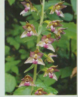
Breitblättrige Stendelwurz Epipactis helleborine