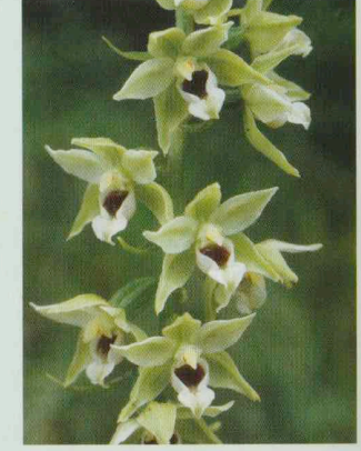
Müllers Stendelwurz Epipactis muelleri