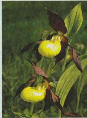
Frauschuh Cypripedium calceolus