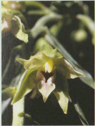
Schmallippige Stendelwurz Epipactis leptochila ssp. leptochila