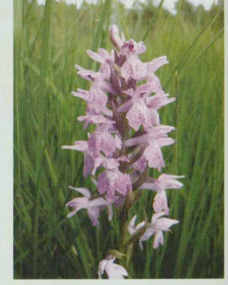
Torfmoos-Fingerwurz Dactylorhiza sphagnicola