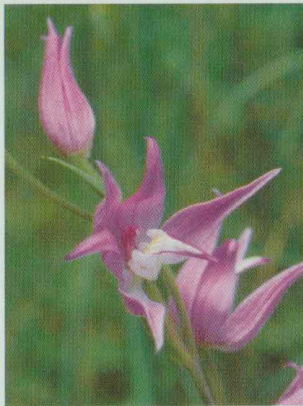
Rotes Waldvögelein Cephalanthera rubra