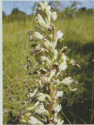
Bocks-Riemenzunge Himantoglossum hircinum