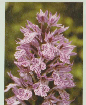
Dreizähniges Knabenkraut Orchis tridentata