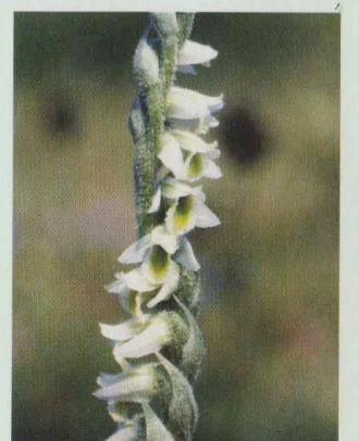
Herbst-Drehwurz Spiranthes spiralis