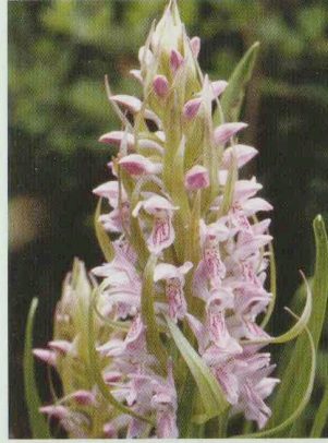
Fleischfarbene Fingerwurz Dactylorhiza incarnata