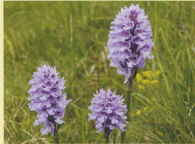
Hochblüte Anfang - Mitte Mai

Der 20-50 Blüten umfassende Blütenstand ist zunächst kegelförmig, dann halbkugelig und erreicht im Laufe der Aufblühphase eine walzenförmige Gestalt. Die Einzelblüten sitzen in der Achsel häufig zugespitzter Tragblätter, die etwa so lang wie die Fruchtknoten sind. Sie tragen einen geschlossenen Helm von oftmals auch verwachsenen Kelch- und Kronblättern. Diese sind außen hellrosa bis violettrosa gefärbt mit einer dunkel gefärbten Nervatur. Die Blütenlippe ist deutlich dreigeteilt.