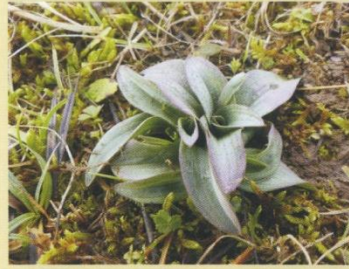
Winterblätter im Januar

Das Dreizählige Knabenkraut entwickelt im Spätherbst aus zwei kugelig bis eiförmigen, unterirdischen Knollen eine Winterblattrosette mit 5-8 bläulichgrünen, ungefleckten Grundblättern. Mit diesen assimilieren die Pflanzen im Winter. Dieses besondere Verhalten, welches auch für die heimischen Ragwurz-Arten gilt, weist darauf hin, dass die Art ursprünglich in Gegenden mit milden Wintern vorkam. Geringe Schneeaufgaben und vor allem Kahlfröste schwächen die Pflanzen, was wiederum Auswirkungen auf die Blühfähigkeit haben kann.