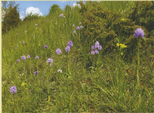
Typisches Biotop: Kalkmagerrasen mit Wacholdergebüsch über Zechstein

Mit der Orchidee des Jahres 2019, auch unter der ursprünglichen Artbezeichnung Orchis tridentata SCOP., 1772 bekannt, wollen die Arbeitskreise Heimische Orchideen Deutschlands auf eine Art aufmerksam machen, welche innerhalb der Bundesrepublik Deutschland nur inselartig verbreitet ist. Neben einem kleinen Teilgebiet an der Oder erstreckt sich das Hauptareal von Ostwestfalen über das südliche Niedersachsen, Nordhessen und das südliche Sachsen-Anhalt bis nach Ostthüringen. Im Süden bilden die Vorkommen entlang der Rhön und des Grabfeldes die Hauptverbreitungsgrenze. In Thüringen und Hessen kommt diese Orchideenart in teilweise aspektbildenden Beständen auf Halbtrockenrasen und ausgehagerten Mähwiesen über Zechstein und Muschelkalk vor. Die mediterran-submediterrane Art ist in Süddeutschland außer in einem kleinen Teilareal nicht anzutreffen. Sie kommt in einem geschlossenen Verbreitungsgebiet erst wieder in den Südalpen und im Mittelmeergebiet vor.