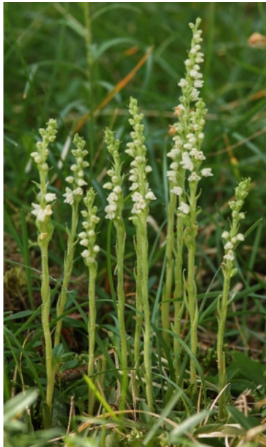
Kräftige Pflanzengruppe, Oberfranken

Wie alle unsere heimischen Orchideen, ist es eine ausdauernde krautige Pflanze, jedoch die einzige mit immergrünen Blättern. Aus den horizontal kriechenden, verästelten, fleischigen Rhizomen zweigen seitliche Triebe ab, aus denen sich die Blattrosetten entwickeln. Je nach Witterung und Wachstumsbedingungen kommen davon mehr oder weniger viele zur Blüte.