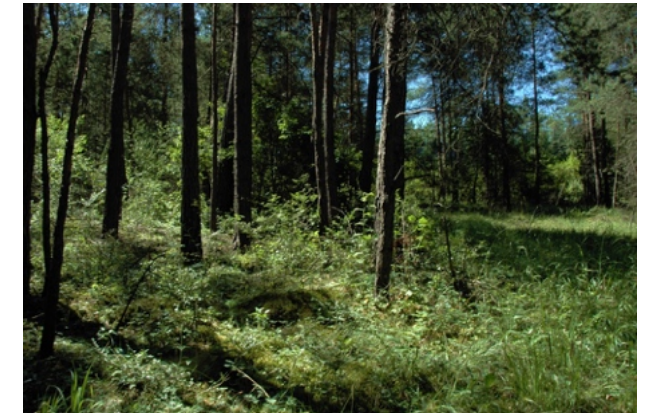
Kiefernwald in der Rhön, Wuchsort des Kriechenden Netzblattes

Nachdem das Kriechende Netzblatt in der 2. Hälfte des 20. Jahrhunderts durch weit verbreitete Kiefernaufrüstungen zunächst profitierte und im Bestand zunahm, gingen die Vorkommen bereits um die Jahrtausendwende zurück, weil viele Kiefernforste sich auf natürliche Weise zu Mischwäldern weiterentwickeln oder weil aufgrund forstlicher Maßnahmen diese Entwicklung gefördert und beschleunigt wird. Lokal bedroht ist diese kleine und konkurrenzschwache Art jedoch auch durch die großen Wildschwein-Bestände, die in den moosreichen Wuchsorten oftmals starke Schäden anrichten.