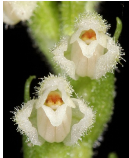
Nahaufnahme der Blüten mit deutlich erkennbarer Behaarung

Die Sepalen und Petalen stehen glockig zusammenneigend, auch sie sind außen drüsig behaart. Die Lippe ist spornlos, jedoch im hinteren Teil bauchig ausgebildet und nektarführend. Nach vorne läuft sie rinnig, spitz und abwärts gebogen aus. Die Bestäubung erfolgt durch Bienen.