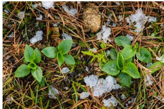
Blattrosetten des Kriechenden Netzblattes im Winter

Das Kriechende Netzblatt wächst vorwiegend in moosigen, nicht zu trockenen Nadelwäldern. Solche Lebensräume kommen in Mitteleuropa als Primärhabitats in den Alpen und im Alpenvorland sowie teilweise in Küstenbereichen vor. Die Nadelwälder im Mittelgebirgsraum sind hingegen überwiegend Sekundärbiotop, die auf Anpflanzungen oder Samenflug zurückgehen.