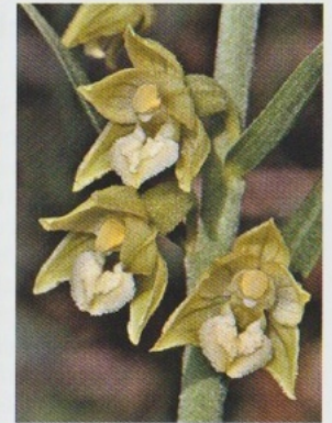
links: hellere Farbvariante, rechts: var. lutescens