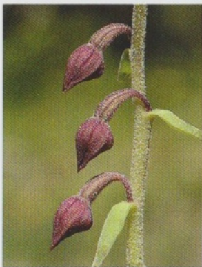
Links: Austrieb mit typisch wechselständigen Blättern, rechts: Knospen kurz vor dem Öffnen der Blüten