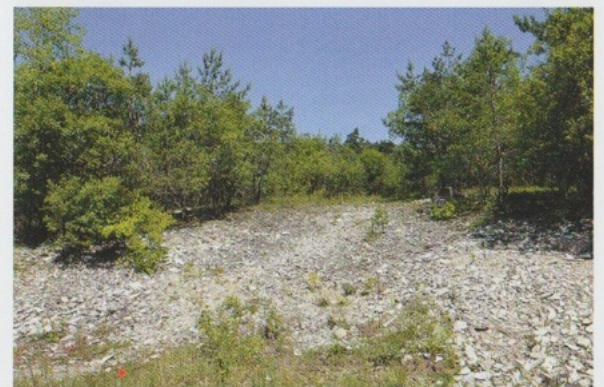
Kalkschotterflur in der Nördlichen Frankenalb, typischer Lebensraum der Braunroten Ständelwurz

Die lichtliebende Art wächst am liebsten auf Kalk, braucht jedoch zumindest kalkhaltigen Grund mit nichtsaurer Reaktion des Bodens. Die Braunrote Ständelwurz gilt als Pionierart, sie besiedelt vorzugsweise Magerrasen auf trockenen Rohböden sowie nährstoffarme Lehm Böden. Man kann die Spezies sowohl in xerothermen Säumen und Gebüsch als auch in lichten Kiefern- und Laubwäldern antreffen. Im Gegensatz zu ihren Ansprüchen an die chemische Reaktion ist die Braunrote Ständelwurz hinsichtlich ihrer Anforderung an die mechanische Beschaffenheit des Bodens bemerkenswert anpassungsfähig. Das Spektrum reicht von diluvialen Sanden bis hin zu trockenen steinigen Böden oder gar öden Geröllhalden. Besonders häufig besiedelt Epipactis atrorubens sogenannte Sekundärstandorte wie Steinbrüche und Sandgruben sowie Weg- und Straßenränder.